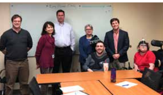
Primer Reunión de NCEN como miembro de la Red AIDD de Carolina del Norte.

La Red ADA de Carolina del Norte apoya grupos de base liderados por personas con discapacidades, para conducir proyectos que promuevan el cumplimiento voluntario del Acta de Estadounidenses con discapacidades (ADA) en sus comunidades locales.