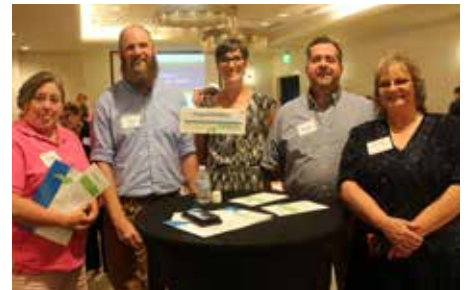
Representantes del Proyecto SEARCH