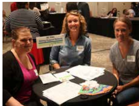
Representantes de red de apoyo de NC Sibs Sibling