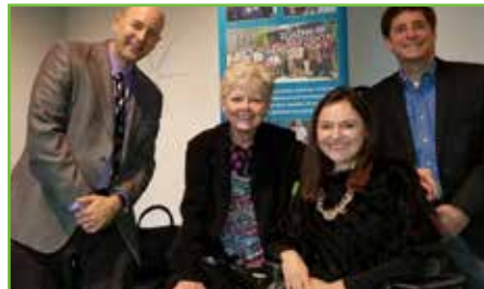
Conferencia The Power of Play

Las series cubrieron información pertinente a los beneficios de la Administración del Seguro Social y Seguridad de Ingreso Suplementario, apoyo laboral, opciones de Medicaid, y otros beneficios médicos. Las series también ayudaron a que