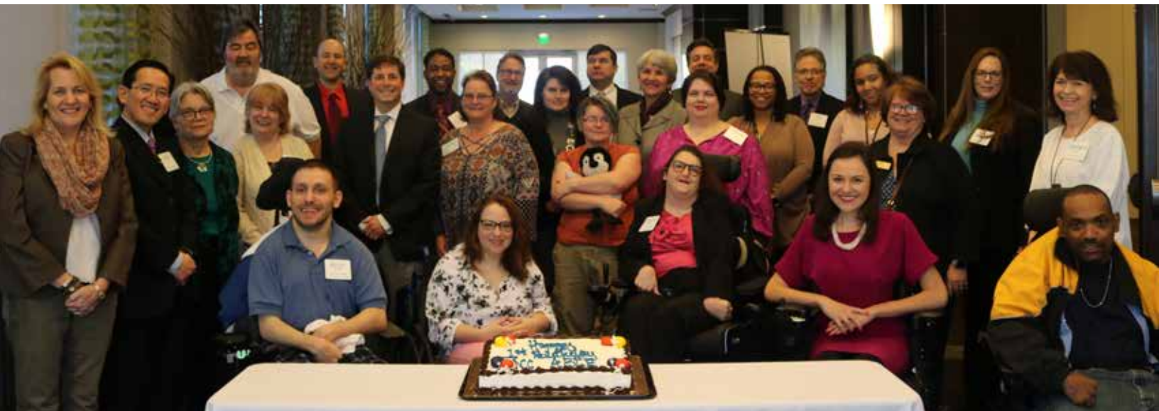
El Consejo de Discapacidades del Desarrollo de Carolina del Norte celebra un año de aniversario del acta ABE de Carolina del Norte en la reunión de 2018.